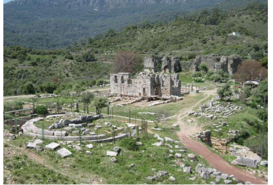
Fiskos (Beldibi, Asartepe)