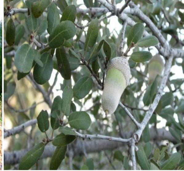
Boz pırnal meşesi