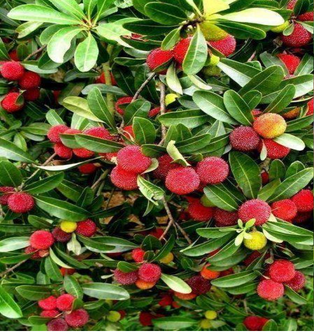
Sandal ağacı (Kocayemiş -Dağçileği)