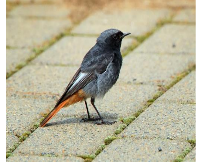
Kara kızıl kuyruk